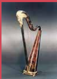
Naderman harp (original)